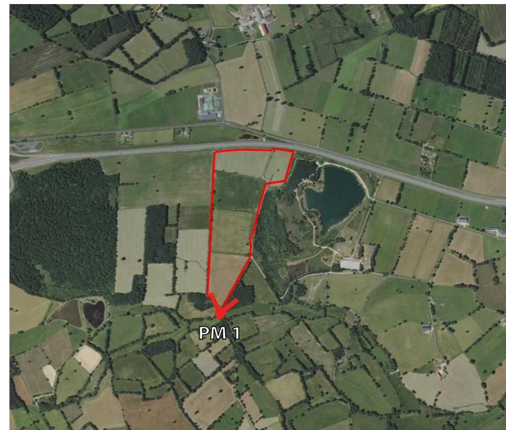
Localisation de la prise de vue