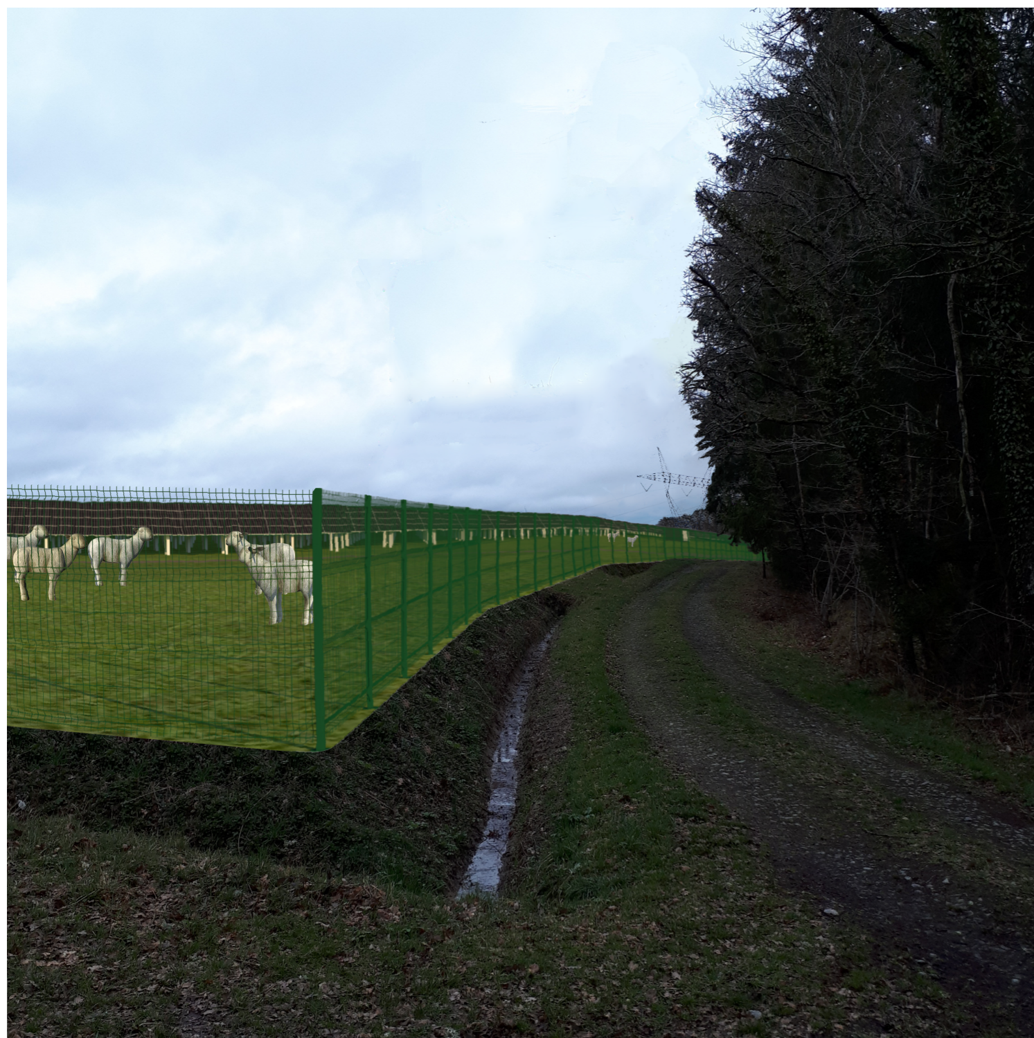
PHOTOMONTAGE 1 - Phase exploitation