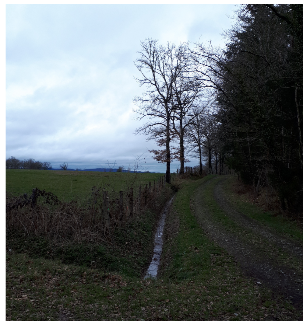
PHOTOMONTAGE 1 - Situation existante