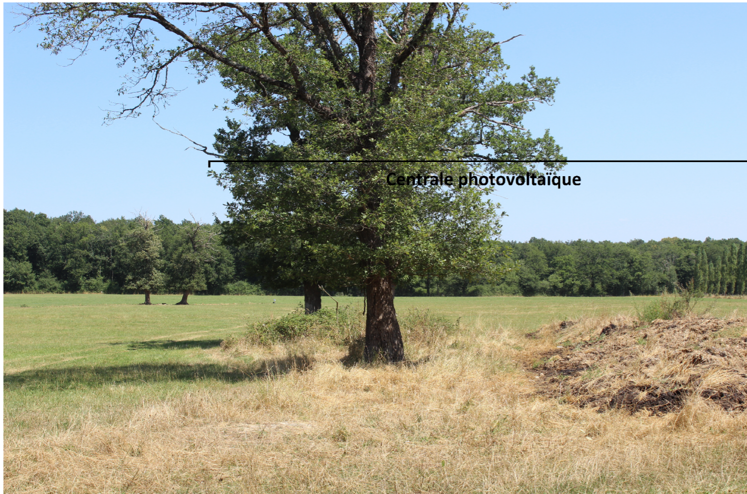
PHOTOMONTAGE 2 - Phase exploitation