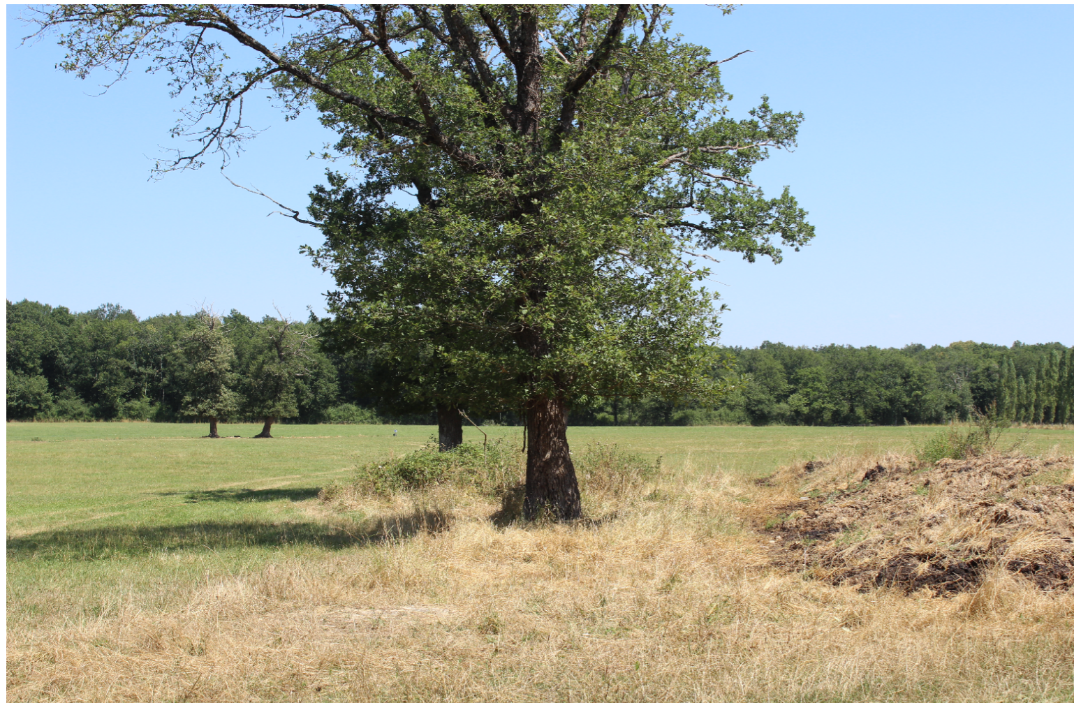
PHOTOMONTAGE 2 - Situation existante